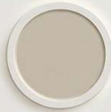
ألوان حجر العلا