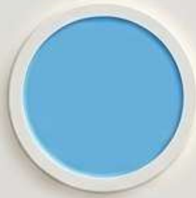
سماء الصحراء الصافية