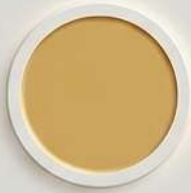
ألوان الرمال الذهبية